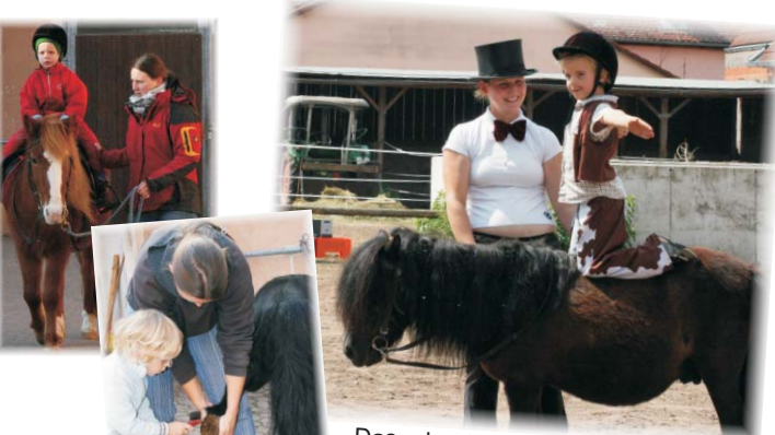
Das erlernte präsentieren wir voller Stolz jährlich in einer Mottoshow

Für alle pferdebegeisterten Kinder, Jugendlichen und Erwachsenen, die Spaß im Umgang mit Pferden haben, oder den Kontakt zu ihnen suchen. Reittherapie ist hilfreich für Menschen mit besonderen Bedürfnissen, oder mit Beeinträchtigungen körperlichen, psychischen oder geistigen Ursprungs. Therapeutisches Reiten ist auch sinnvoll für all diejenigen, die durch das Medium Pferd etwas über sich herausfinden und für ihr körperliches und seelisches Wohlbefinden tun wollen.